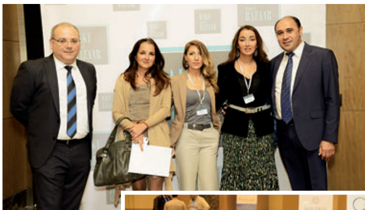
Организаторы и участники Baku Travel Bazaar Exotic