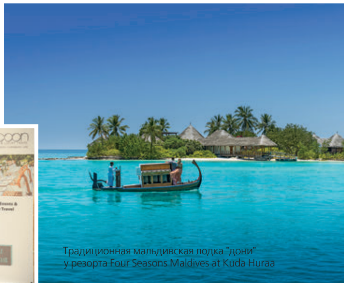
Традиционная мальдивская лодка "дони" у резорта Four Seasons Maldives at Kuda Huraa