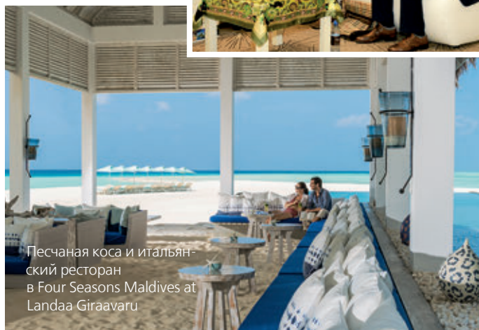
Песчаная коса и итальянский ресторан в Four Seasons Maldives at Landaa Giraavaru